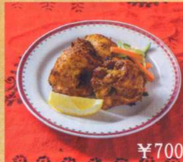
22. ティッカバンジャビ 3P ¥700