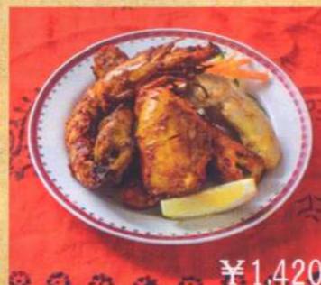
24. サーガルグリル ¥1,420