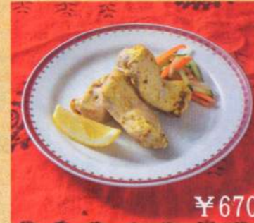
23. ティッカマライ 3P ¥670