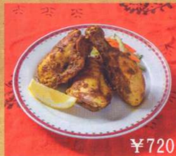
20. タンドリーチキン 3P ¥720