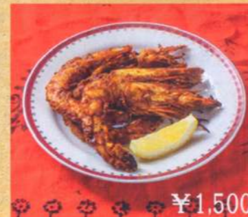
26. タンドリージンガ 3P ¥1,500