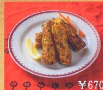
21. シークカバブ 2P ¥670