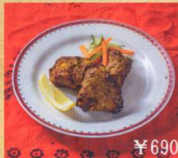
25. フィッシュティッカ 3P ¥690